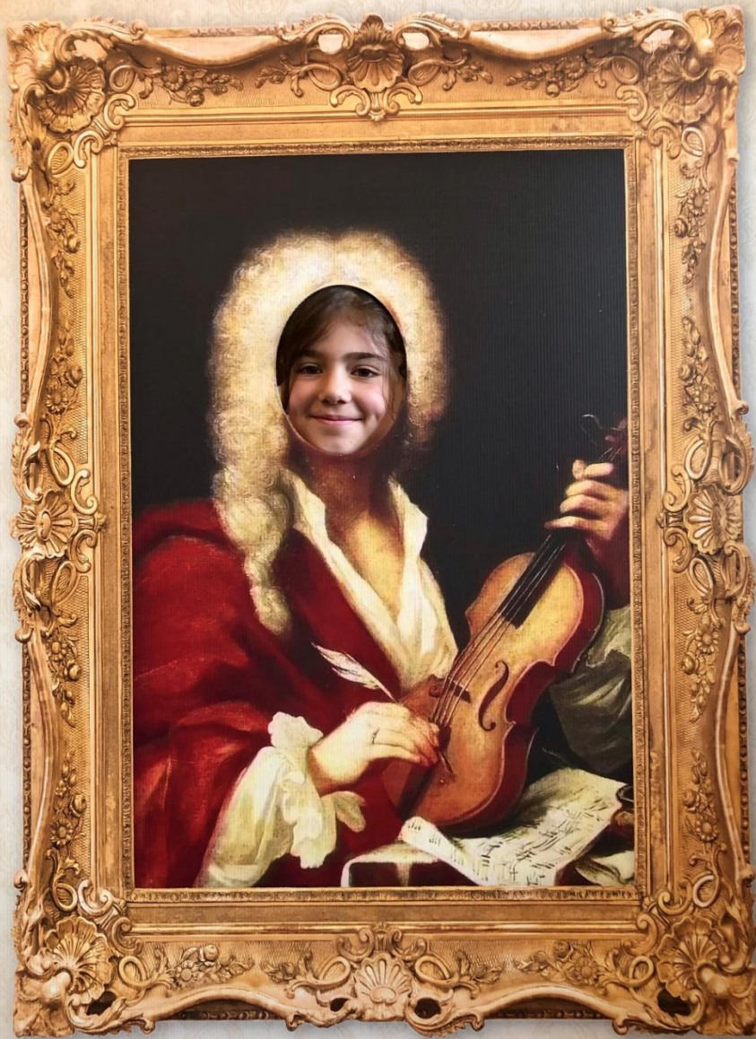
Slovenska filharmonija Antonio Vivaldi (1678 -1741)