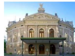
SNG OPERA IN BALET LJUBLJANA