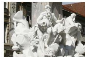
ROBBOV VODNJAK - VODNJAK TREH KRANJSKIH REK - Save, Ljubljanice in Krke.