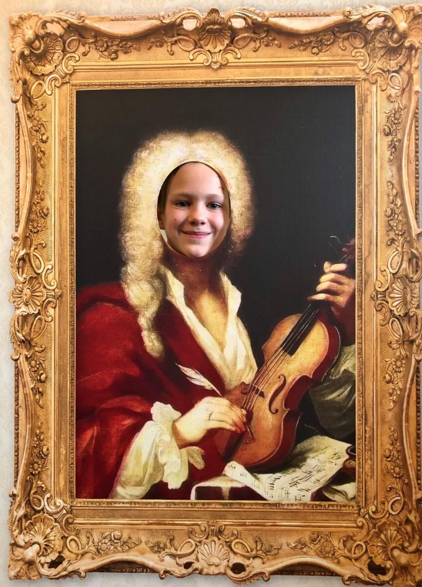
Slovenska filharmonija Antonio Vivaldi (1678 -1741)

Ali to pomeni, da imamo v sebi velik glasbeni potencial?