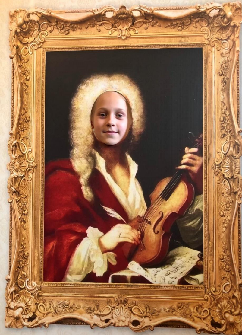
Slovenska filharmonija Antonio Vivaldi (1678 -1741)