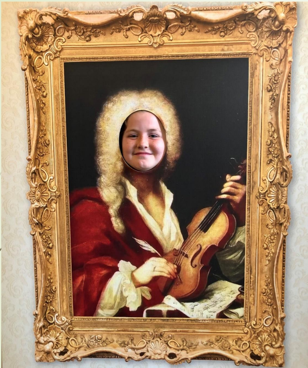
Slovenska filharmonija Antonio Vivaldi (1678 -1741)