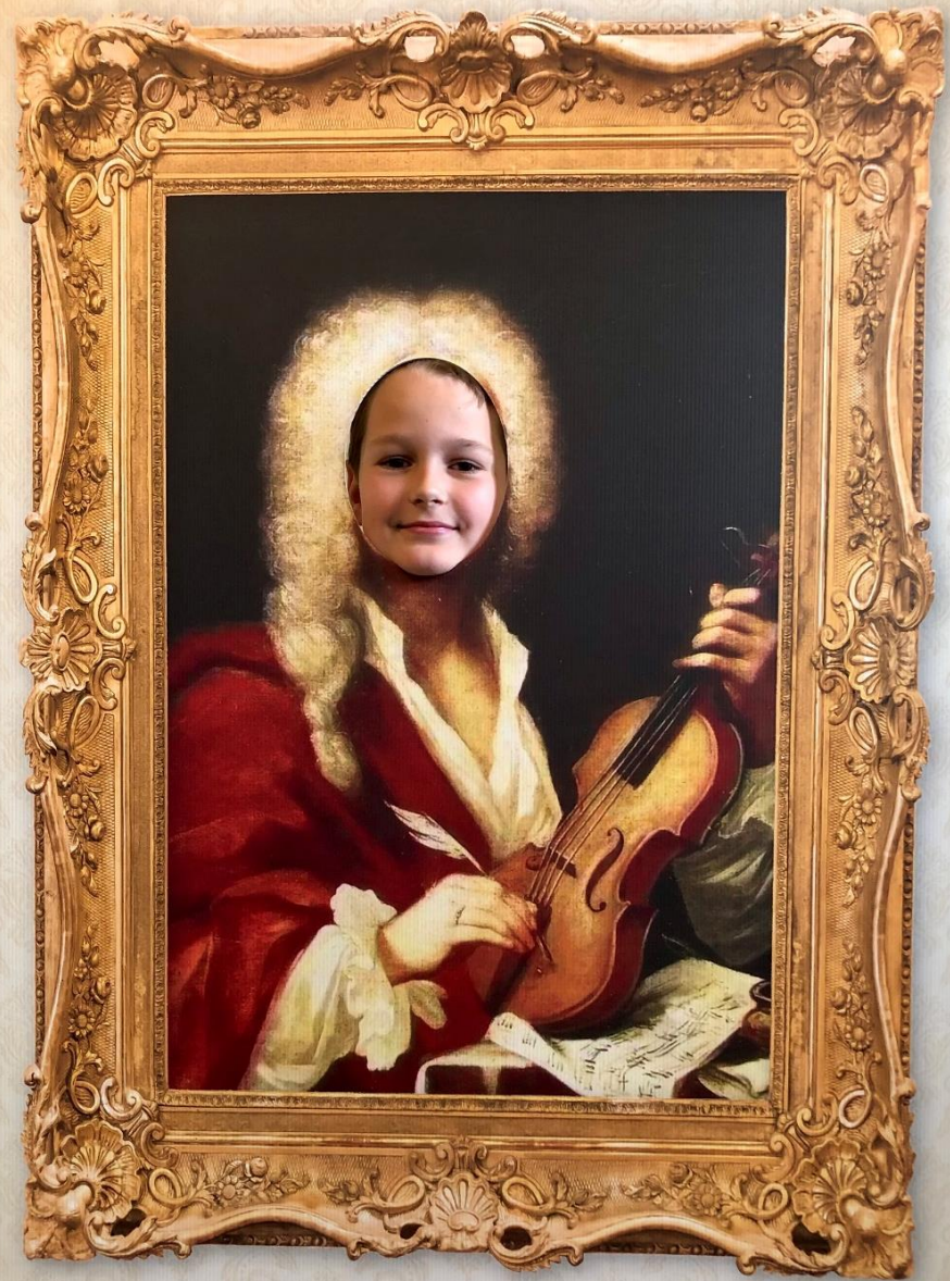
Slovenska filharmonija Antonio Vivaldi (1678 -1741)