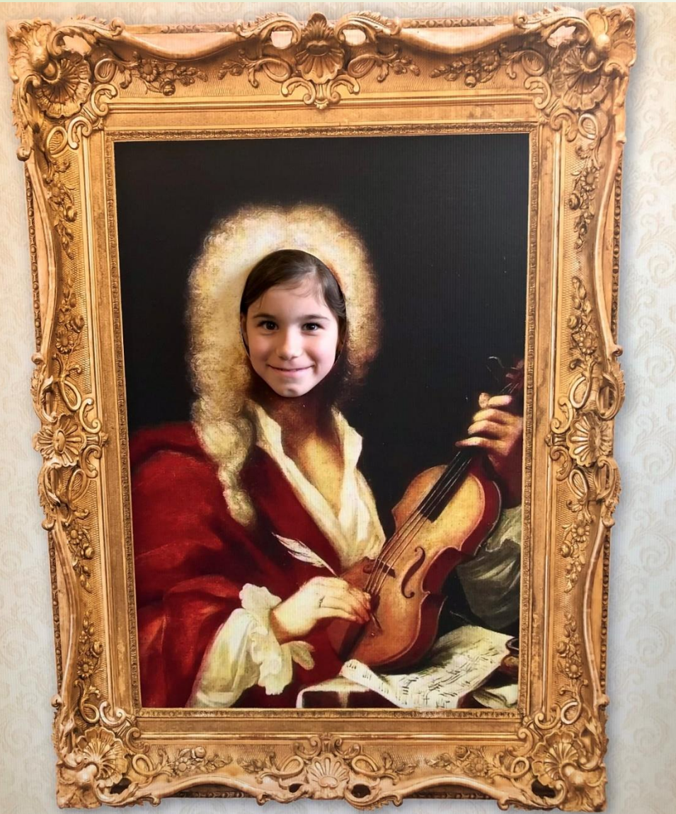
Slovenska filharmonija Antonio Vivaldi (1678 -1741)