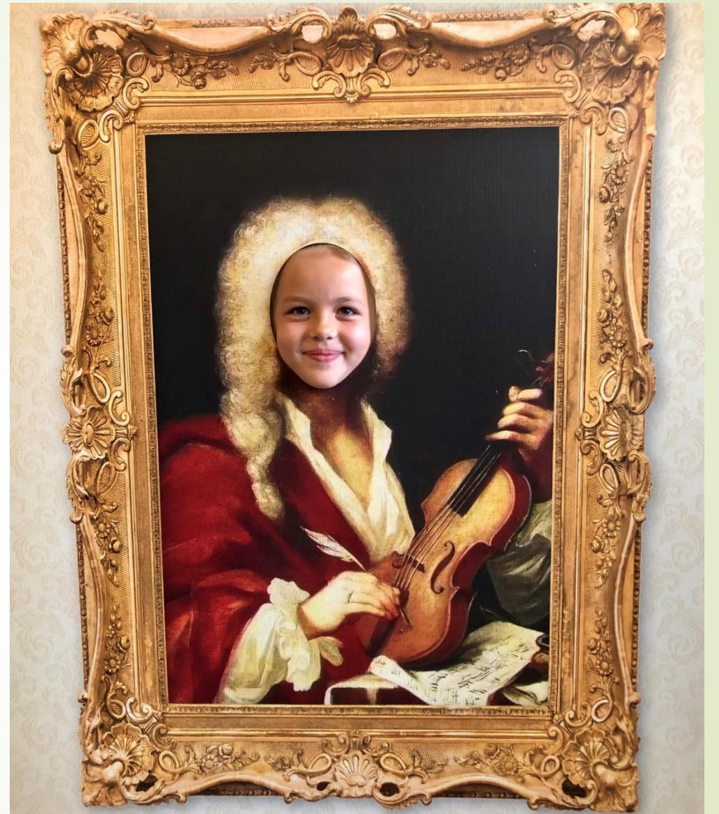
Slovenska filharmonija Antonio Vivaldi (1678 -1741)