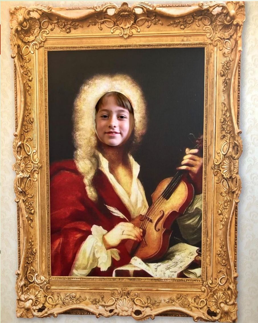
Slovenska filharmonija Antonio Vivaldi (1678 -1741)