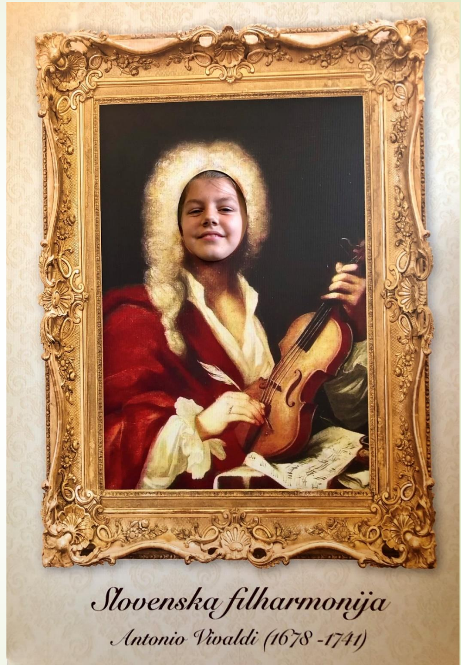
Slovenska filharmonija Antonio Vivaldi (1678 -1741)